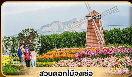
สวนดอกไม้จางเซ่อ