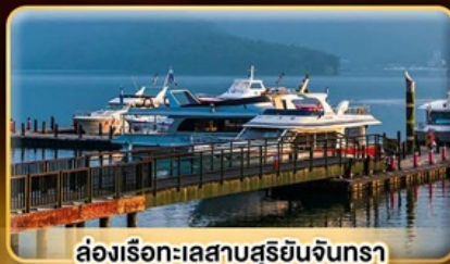
ล่องเรือทะเลสาบสุริยจันทร