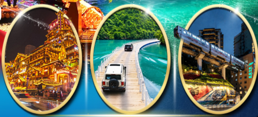
หงหยาดิง ประตูดงซิงโดแห่งเซวียนเอิน รถไฟฟ้าทะเลลึก

ราคาเริ่มต้น 20,919 บาท รวมภาษีมูลค่าเพิ่ม 7%