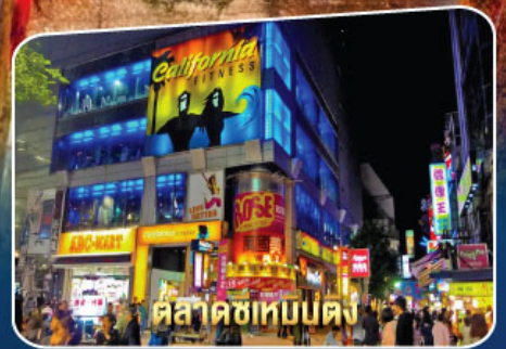
ตลาดซีเหมินตง