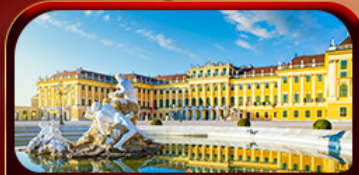
พระราชวังเฮินบรุนน์