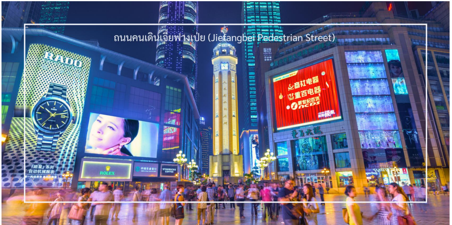
ถนนคนเดินเจียงเป่ย์ (Jiefangbei Pedestrian Street)