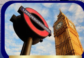
มหานครลอนดอน