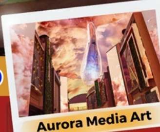
Aurora Media Art