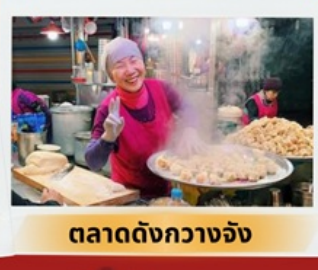
ตลาดดังกวางจิ่ง