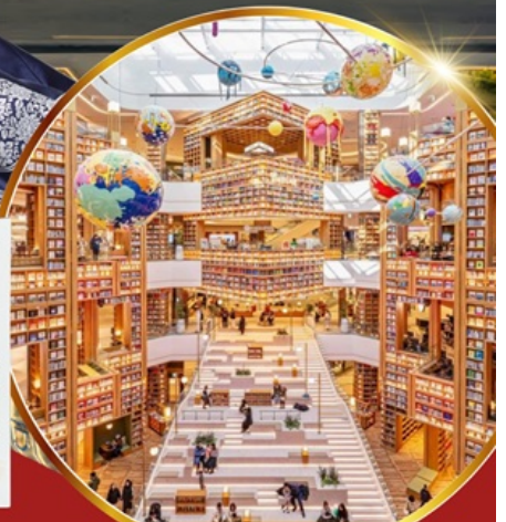
ห้องสมุด สตาร์ฟิลด์ ซูวอน

เช็คอินห้องสมุดสุดอลังการ ชมศิลปะดิจิทัลสุดล้ำ บนจอ LED เสมือนจริงขนาดยักษ์ หมู่บ้านเกาหลีโบราณมุกซอน อื่นๆ อิสระซ็อบปัง 2 ย่านดัง ซองซู เมียงดง ซ็อบปาลอดภาษี Lotte Duty Free