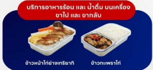
บริการอาหารร้อน และ น้ำดื่ม บนเครื่อง ขาไป และ ขากลับ