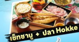
เซ็ทชาบู + ปลา Hokke

36,919 ราคา เริ่มต้น บาท รวมภาษีมูลค่าเพิ่ม 7%