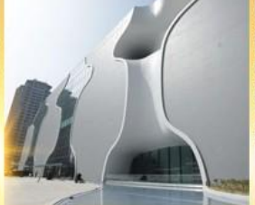
โรงละครโดง