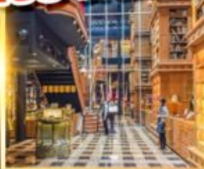
ร้านไอศกรีมมียาฮาร่า