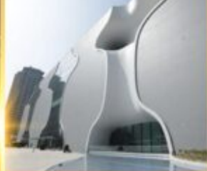
โรงละครโดง