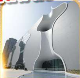
โรงละครโดง