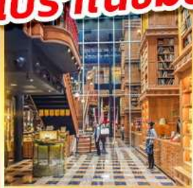
ร้านไอศกรีมมียาฮาร่า