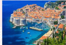
เมืองดูบรอฟนิก