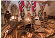
ปราสาทเพรจามา

** พักที่ Radisson Blu Plaza Hotel 4* หรือเทียบเท่า **