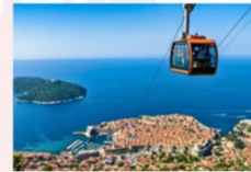
Cable Car Ride