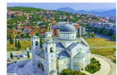
Cathedral of the Resurrection of Christ

20.40 น. ออกเดินทางสู่สนามบินอิสตันบูล เที่ยวบิน TK1088