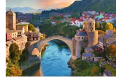
สะพานเก่า Mostar

** พักที่ City Hotel 4* หรือเทียบเท่า **