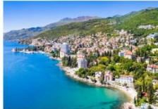
เมืองโอพาเทีย

** พักที่ Paris Hotel 4* หรือเทียบเท่า **