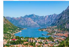
เมืองกอเตอร์

** พักที่ Bracera Hotel 4* หรือเทียบเท่า **