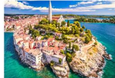
เมืองโรวินจ์