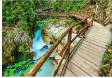
หุบเขาวิทการ์จอร์จ

** พักที่ Radisson Blu Plaza Hotel 4* หรือเทียบเท่า **