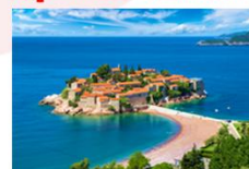
หมู่บ้านสเวติ สเตฟาน