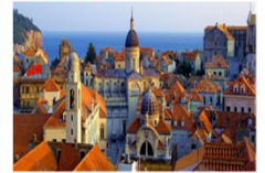
เมืองเก่า

** พักที่ Adria Hotel 4* หรือเทียบเท่า **