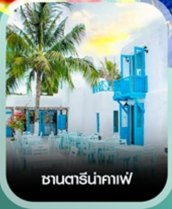
ซานตาน่าคาเฟ่