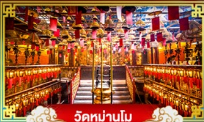
วัดม่านโม