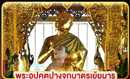
พระอุปคุตปางจากบาตรเขี่ยมาร