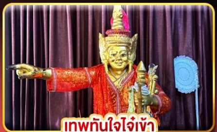
เทพทันใจใจเจ้า