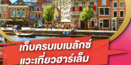
เก็บครบเบเนลักซ์ แวะที่วิวฮาร์เล็ม