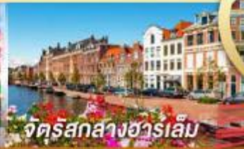
จัตุรัสกลางฮาร์เล็ม