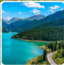
อุทยานเทียนซาน เทียนฉือ