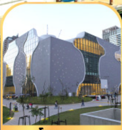
โรงละคร แห่งชาติไถจง