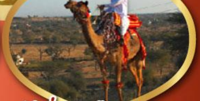
ฟรี ขี่อูฐ เมืองมันทอวา ราคาเริ่มต้น