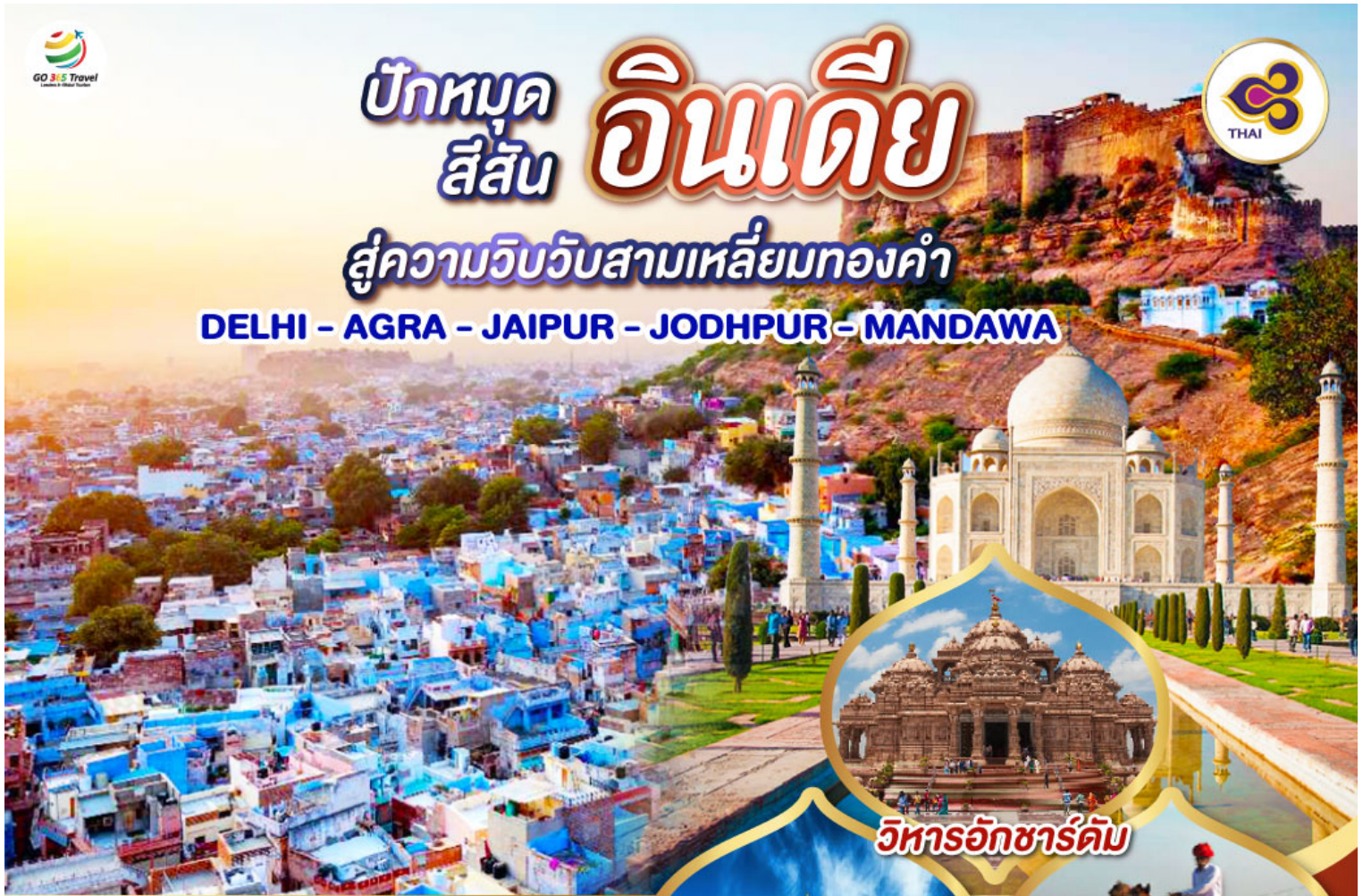
วิหารอักซาร์ดัม

DELHI - AGRA - JAIPUR - JODHPUR - MANDAWA