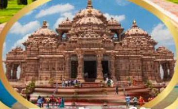
วิหารอักซาร์ดีม