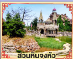
สวนหินงิ้วหวู่