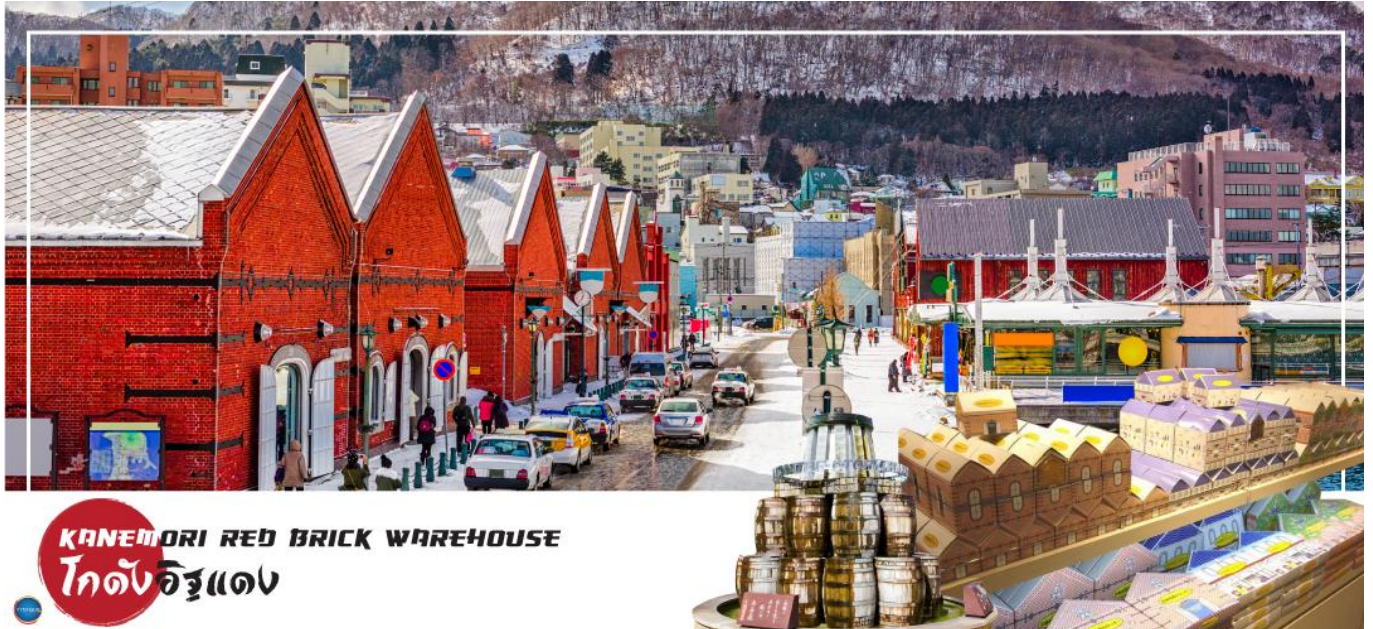
KANEMORI RED BRICK WAREHOUSE โกดังอิฐแดง

วันที่สาม เมืองฮาโกดาเตะ – ตลาดเช้าฮาโกดาเตะ – โกดังอิฐแดง – ย่านเมืองเก่าโมโตมาชิ – ป้อมโกเรียวกาคู (เข้าชม) – ทะเลสาบโทยะ – ออนเซน