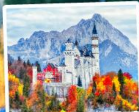
ปราสาทน้อยชวานสไตน์

09-15, 15-21 ต.ค. 68 23-29 ม.ค. / 25 ก.พ.-03 มี.ค. 69 06-12, 18-24 มี.ค. 69 01-07, 09-15, 10-16, 12-18 เม.ย. 69 29 เม.ย.-05 พ.ค. / 30 เม.ย.-06 พ.ค. 69 28 พ.ค.-03 มิ.ย. 69