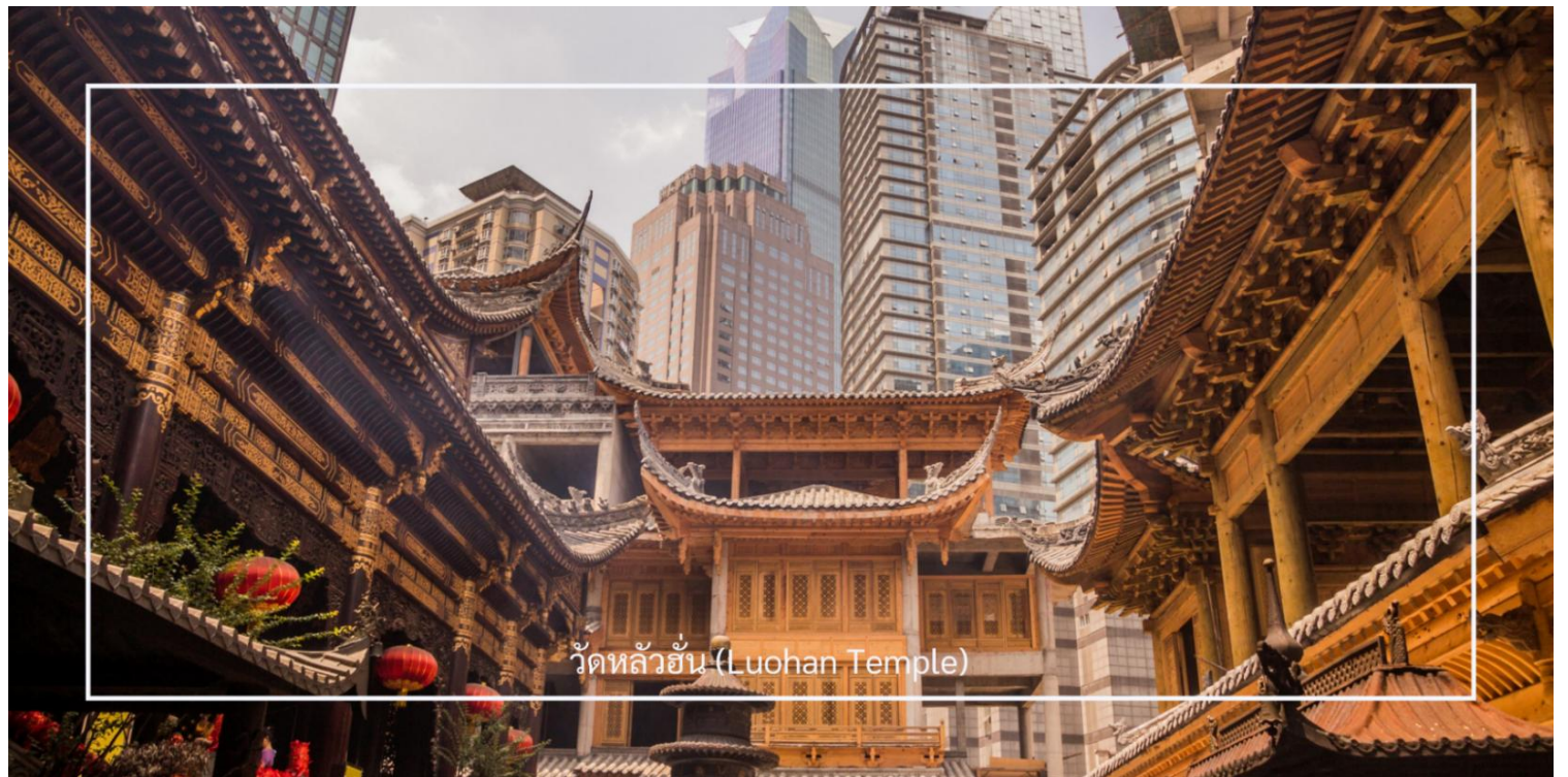
วัดหลัวฮั่น (Luohan Temple)

นำท่านเที่ยวชม วัดหลัวฮั่น (Luohan Temple) หรือที่เรียกว่า "วัดอรหันต์" เป็นวัดที่มีชื่อเสียงในเมืองฉงชิ่ง (Chongqing) มีประวัติศาสตร์ยาวนานและมีความสำคัญในด้านศาสนาพุทธ วัดหลัวฮั่นมีพระพุทธรูปและรูปปั้นอรหันต์จำนวนมาก ซึ่งเป็นที่เคารพนับถือของผู้มาเยือน นอกจากนี้ยังมีบริเวณที่ให้ผู้เข้าชมสามารถทำบุญและสวดมนต์