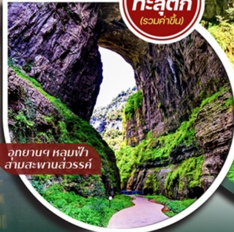
อุทยานฯ หลุมฟ้า สามสะพานสวรรค์