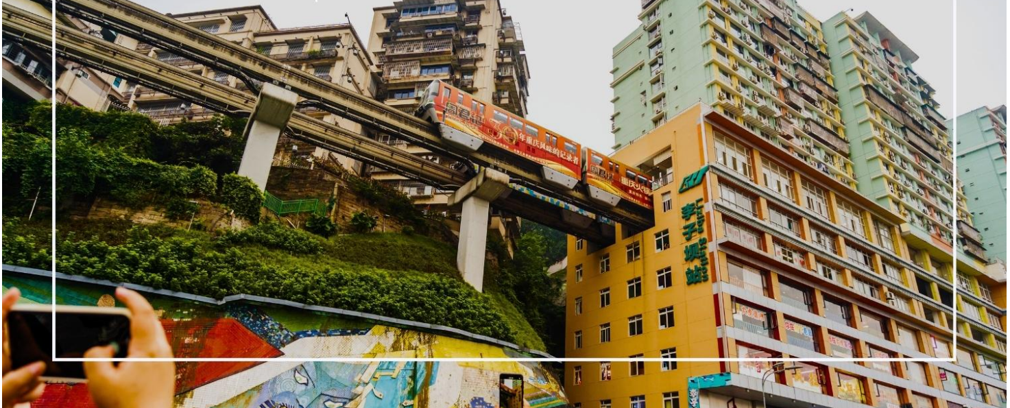
รถไฟทะลุตึก สถานีหลี่จื่อป้า (Monorail train Liziba Station)

นำท่าน นั่งรถไฟทะลุตึก (Monorail train Liziba Station) เป็นหนึ่งในประสบการณ์ที่น่าสนใจและเป็นเอกลักษณ์ในเมืองฉงชิ่ง รถไฟเส้นนี้มีเส้นทางที่ผ่านอาคารและที่อยู่อาศัย ทำให้ผู้โดยสารรู้สึกเหมือนกำลังนั่งรถไฟที่ทะลุผ่านตึกสูง เส้นทางที่น่าสนใจในรถไฟนี้รวมถึงสถานีที่มีชื่อเสียง เช่น สถานีหลี่จื่อป้า (Liziba Station) ซึ่งตั้งอยู่ในพื้นที่ที่มีความหนาแน่นของประชากร การนั่งรถไฟทะลุตึกนี้เป็นวิธีที่ยอดเยี่ยมในการสัมผัสกับวัฒนธรรมเมืองฉงชิ่งและชื่นชมกับการพัฒนาเมืองที่น่าทึ่ง หากคุณมีโอกาสไปเยือนฉงชิ่ง อย่าลืมลองนั่งรถไฟเส้นนี้เพื่อสัมผัสประสบการณ์ที่ไม่เหมือนใคร