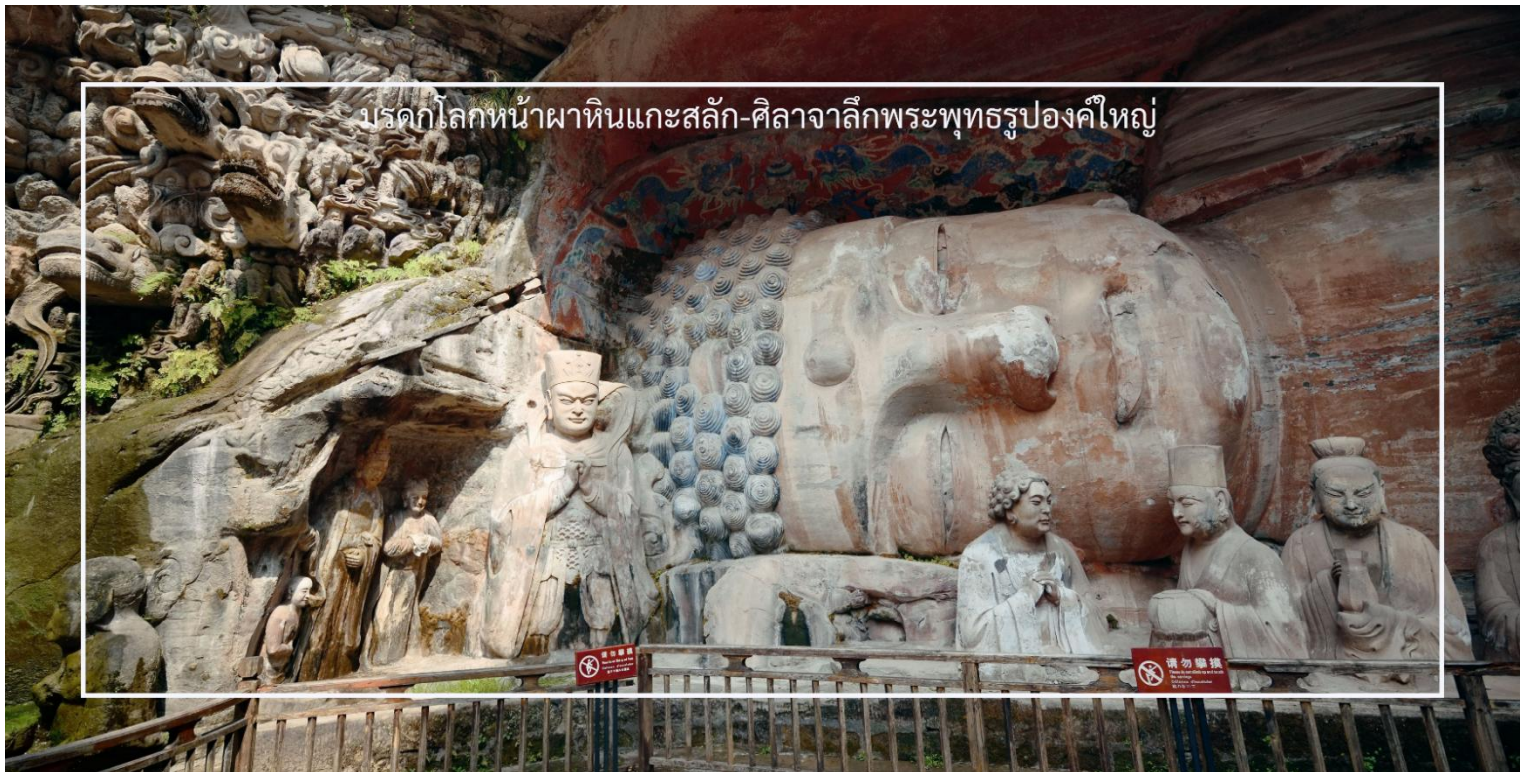
มรดกโลกหน้าผาหินแกะสลัก-ศิลาจากลี้พระพุทธรูปองค์ใหญ่

สถานที่สำคัญทางประวัติศาสตร์และศิลปกรรมอันล้ำค่า ตั้งอยู่ที่เขาเป่าตังซาน เมืองต้าจู๋ มณฑลเสฉวน ประเทศจีน ได้รับการขึ้นทะเบียนเป็นมรดกโลกโดยองค์การยูเนสโก ผลงานแกะสลักบนหน้าผาหินเหล่านี้มีอายุย้อนไปกว่า 1,200 ปี เป็นศิลาจากลี้พระพุทธรูปขนาดใหญ่ รวมถึงภาพจำหลักอันวิจิตรสะท้อนถึงแนวคิดพุทธศาสนา เต๋า และขงจื้อ ที่ผสมผสานอยู่ในงานศิลป์เดียวกัน ซึ่งภายในจะมีจุดเด่นที่สำคัญอันได้แก่