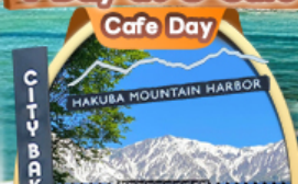
The City Bakery