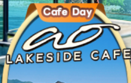
Ao Lakeside Cafe