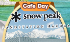
Snow Peak Land Hakuba