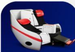
ที่นั่งพรีเมียมแฟลตเบด

บริการอาหารร้อน และ น้ำดื่ม บนเครื่อง ขาไป และ ขากลับ