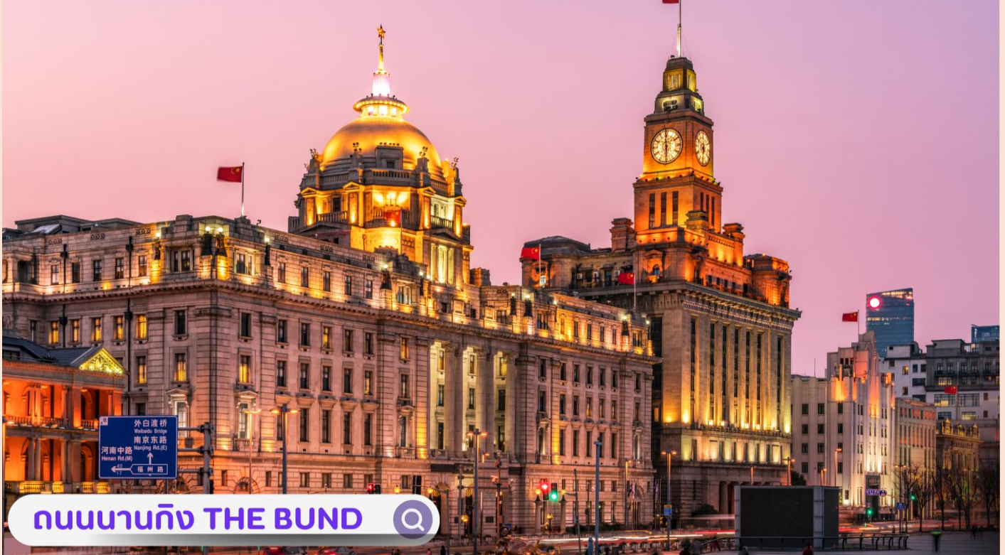
ถนนนานกิง THE BUND

จากนั้นอิสระท่านเฟลิตเฟลินที่ ถนนนานกิง(NANJING ROAD) เป็นย่านช้อปปิ้งเก่าแก่ที่สุดของเซี่ยงไฮ้ เป็นตลาดซื้อขายของกันคึกคักตั้งแต่ทศวรรษ 1920 ตั้งอยู่ฝั่งผู้ซีกินพื้นที่ยาวตั้งแต่ฝั่งตะวันตกของ “เดอะ บันด์” ถึง “พีเพิลส์ สแควร์” เป็นแหล่งช้อปปิ้งสินค้าแบรนด์เนมจากทั่วโลก และยังเป็นศูนย์รวมร้านค้าและร้านอาหารอีกมากมาย และพลาดไม่ได้กับนักจุ่มอาร์ทหายอย่าง แบรินด์ POPMART GLOBAL FLAGSHIP STORE ร้านขายของเล่นที่เป็นที่โด่งดังในขณะนี้ไม่ว่าจะ LABUBU MOLLY SKULLPANDA และอย่างอื่นอีกมากมาย ให้ท่านได้เลือกลุ้นกับอย่างสนุกสนาน