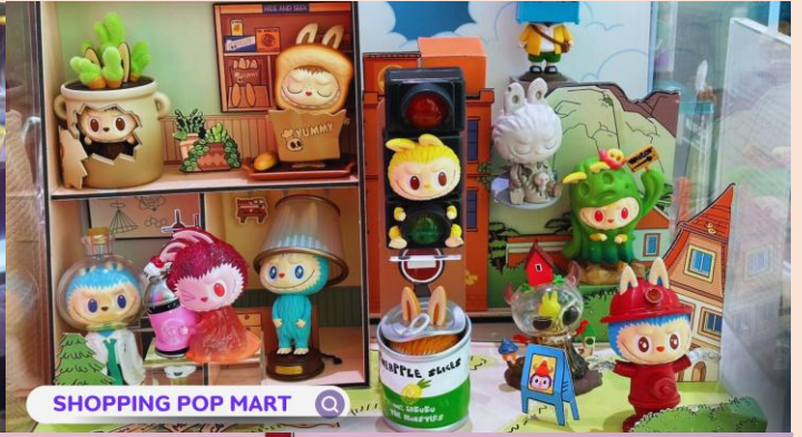
SHOPPING POP MART