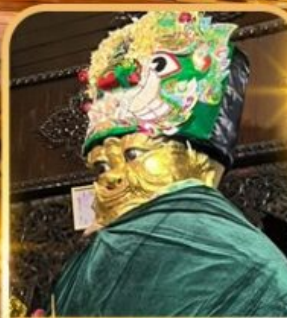
แม่ยักษ์