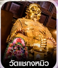
วัดเชกกงมือ