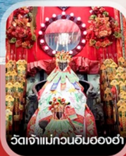
วัดเจ้าแม่กวนอิมของฮ่า

✈️ คอนเฟิร์มออกเดินทาง ✈️ ทุกพีเรียด 2 ท่านขึ้นไป