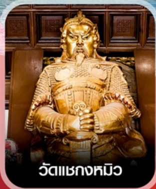
วัดแซกทมิว