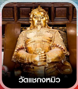
วัดแซกซงหมิว