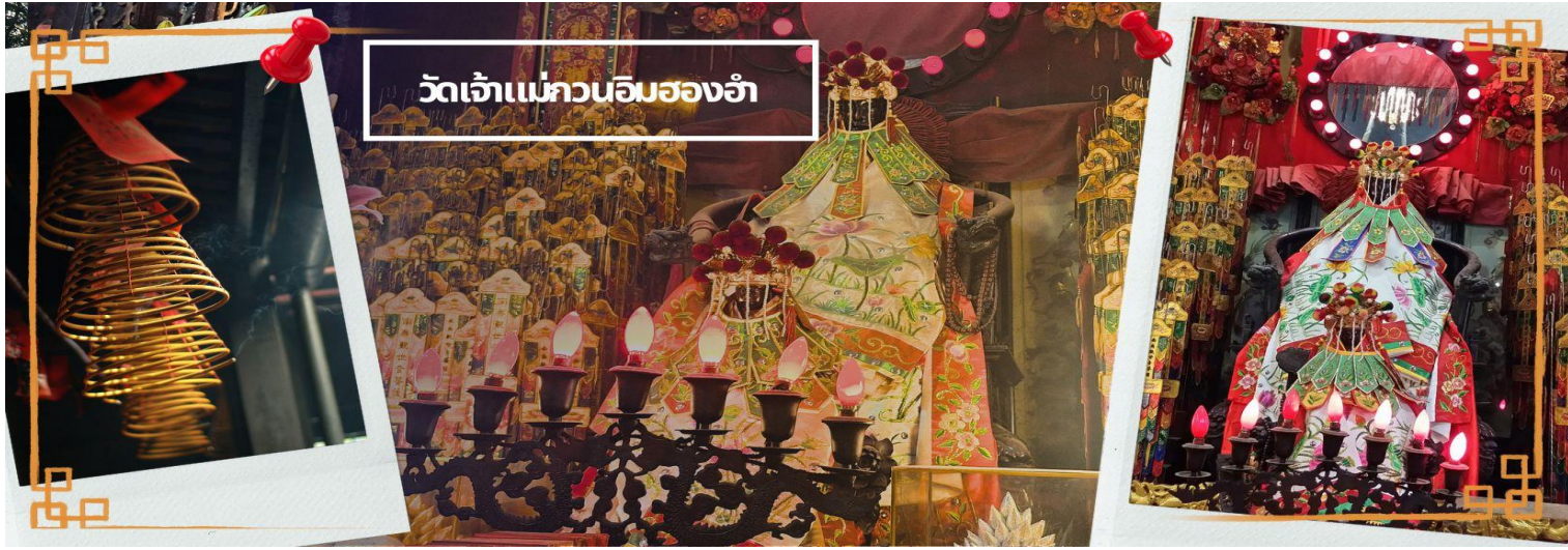
วัดเจ้าแม่กวนอิมของอำ

จากนั้นนำท่านชม โรงงานจิวเวอรี ซึ่งเป็นโรงงานที่มีชื่อเสียงที่สุดของฮ่องกงในเรื่องการออกแบบเครื่องประดับ อาทิเช่น จี้ และแหวนกำหัตน์ ที่สวยงามโดดเด่นไม่เหมือนใคร ซึ่งถือกำเนิดขึ้นที่นี่และมีชื่อเสียงที่สุดใช้เป็นเครื่องประดับติดตัว และเสริมดวงชะตา สินค้าทุกชิ้นมีเอกสารรับประกันคุณภาพเปลี่ยน ซ่อม ได้ตลอดอายุการใช้งาน หากเกิดการชำรุดจากสินค้า ไม่ใช่อุบัติเหตุ