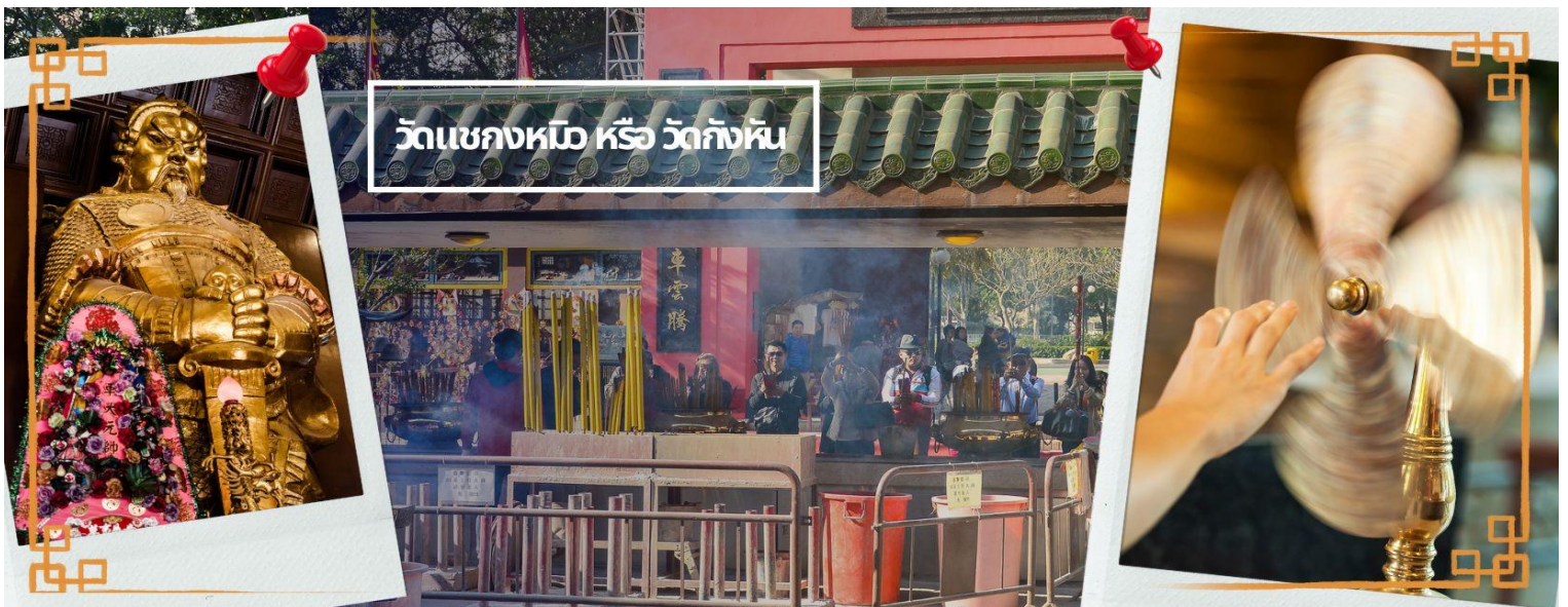
วัดแชกงหมิว หรือ วัดกังหัน

จากนั้นนำท่านเดินทางไป วัดแชกงหมิว หรือ วัดกังหัน (CHE KUNG TEMPLE) วัดแชกงสร้างขึ้นเพื่อเป็นอนุสรณ์เพื่อรำลึกถึงตำนานแห่งนักรบราชวงศ์ซ่ง มีนามว่า “แช กง” แม่ทัพปราบศึก ผู้คนทั่วทุกดินแดนต่างยำเกรงในกำลังพลอันกล้าหาญแข็งแกร่งของแม่ทัพแชกง เป็นวัดเก่าแก่ที่มีความศักดิ์สิทธิ์มาก มีอายุกว่า 300 ปีตั้งอยู่ในเขต SHATIN มีประวัติเล่าต่อกันมาว่า ขณะที่เป็นแม่ทัพปราบศึกอยู่นั้น ทุกแคว้นเขตแดนแผ่นดินใหญ่ต่างก็ยำเกรงต่อกำลังพลที่กล้าหาญในกองทัพของท่าน ยามที่ออกรบเพื่อต้านข้าศึกศัตรูทุกทิศทาง ทุก ๆ ครั้ง ท่านใช้สัญลักษณ์รูปกำหัตน์ 4 ใบพัดติดไว้ด้านหลังรถศึกนำขบวนในกองทัพ เหล่าทหารกล้ามีความเชื่อว่าเมื่อพก พาสัญลักษณ์รูปกำหัตน์นี้ไป ณ ที่ใด ๆ กำหัตน์นี้จะช่วยเสริมสิริมงคล นำพาแต่ความโชคดี เสริมกำลังใจให้แก่กองทัพของท่าน ชื่อเสียงในการนำทัพสู้ศึกของท่านจึงเป็นตำนานมาจนทุกวันนี้ ปัจจุบันวัดแชกง จึงเป็นสถานที่สักการะเคารพ ขอพร ท่านแชกง โดยมีสัญลักษณ์เป็นกำหัตน์นำโชค