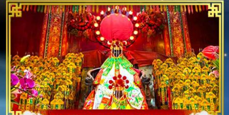
วัดเจ้าแม่กวนอิมสองฮ่า