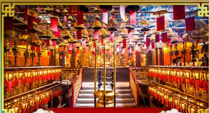
วัดม่านโม

พักกลางวัน "จิมซาร์จ" บินหรือลงเทศกาลปีใหม่ ณ เกาะฮ่องกง