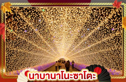
นากานอนะซาโตะ

"ชมความงามของฤดูใบไม้เปลี่ยนสี" เที่ยวครบจบทุกไฮไลท์ โอซาก้า-โตเกียว พิเศษ!! บินเรือแบบ FULL SERVICE