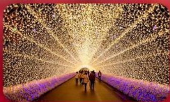
นาบานาโนะซาโตะ