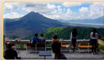
หมู่บ้านคินตามนิ