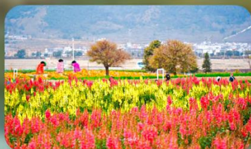
สวนดอกไม้ฮวาอวี๋มู่ฉาง