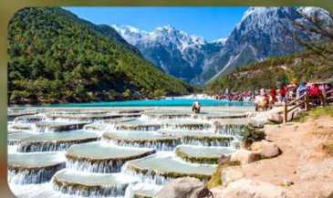
ทะเลสาบไป๋สุยเหอ