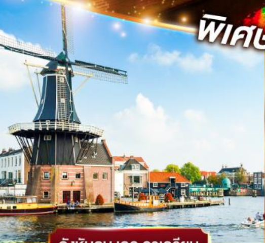
กังหันลม เดอ อาครีเยน