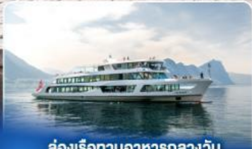
ล่องเรือทานอาหารกลางวัน ทะเลสาบลูเซิร์น