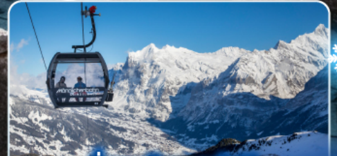
นั่งกระเช้าและรถไฟสู่ ยอดเขาจุงเฟรา