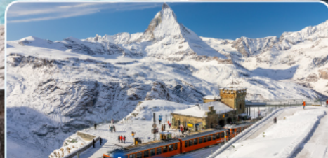
นั่งรถไฟสู่ยอดเขา กรอนเนอร์เกรต