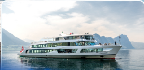
ล่องเรือทานอาหารกลางวัน ทะเลสาบลูซิิร์น