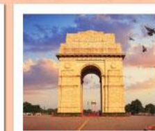
♥♥♥ India Gate