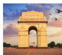
♡♡♡ India Gate