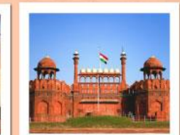
♥♥♥ Agra Fort