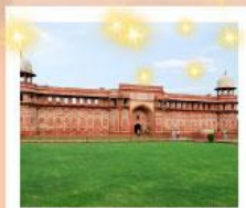
Ajmer Sharif Dargah