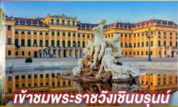
เข้าชมพระราชวังฮินบรุนน์