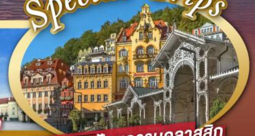
ชมสถาปัตยกรรมคลาสสิก เมือง คาร์โลวี วารี