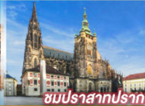
ชมปราสาทปราท