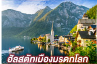
อัลสตัดท์เมืองมรดกโลก