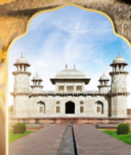
ทัชมาฮาลน้อย

31 พ.ค.-06 มิ.ย. 69 วันเฉลิมพระราชินี 25-30 ก.ค. 69 วันเฉลิมรัชการที่ 10 21-26 ต.ค. 69 วันหยุดปีมะหาราช ถ้ำมรดกโลก เที่ยวได้ตลอดปี