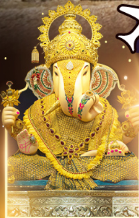
องค์ศักดิ์สิทธิ์