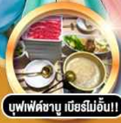
บุฟเฟ่ต์ชาบู เบียร์ไม่อั้น!!