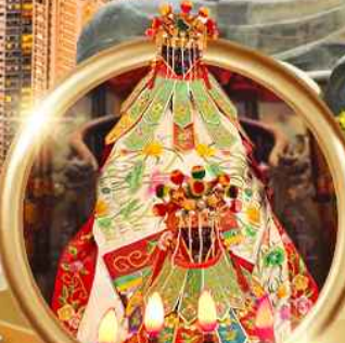
เยี่ยมชมเจ้าแม่กวนอิมสองอำเภอ