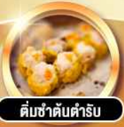
ติ่มซำต้บตำรับ