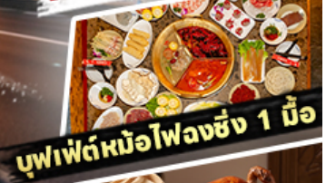
บุฟเฟ่ต์หม้อไฟลงชิง 1 มื้อ