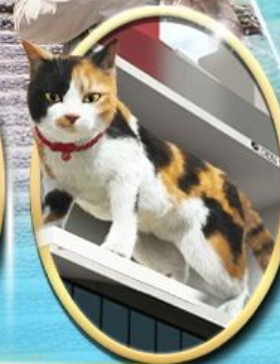
ซ้อมบิง ชินจุกุ