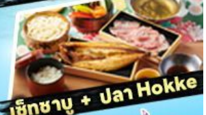
อิชิชานู + ปาน Hokke

36,919 ราคาเริ่มต้น บาท รวมภาษีมูลค่าเพิ่ม 7%