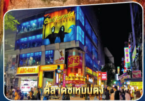
ตลาดซีเหมินตง