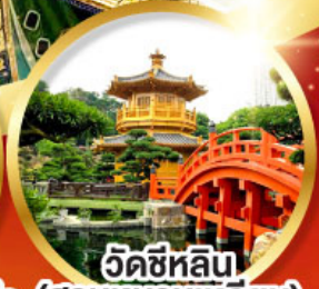
วัดซีหลิน