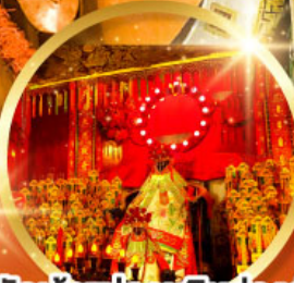
วัดเจ้าแม่กวนอิมอ่องอำ