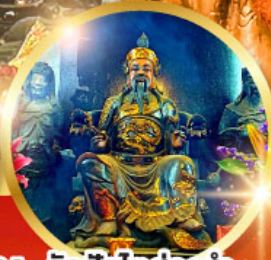
วัดปักโต้อ่องอำ