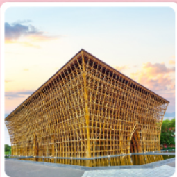
บ้านไม้ไฟ

ไฮไลท์ เที่ยวครบ สวนน้ำ Aquatopia & สวนสนุก Vin Wonder เวนิสแห่งเวียดนาม Grand World Phu Quoc แลนด์มาร์คสุดโรแมนติก