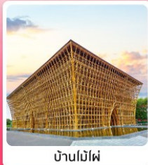
บ้านไม้ไผ่

ไอโวลท์ เทียวครบ สวนน้ำ Aquatopia & สวนสนุก Vin Wonder เวนิสแห่งเวียดนาม Grand World Phu Quoc แลนด์มาร์คสุดโรแมนติก