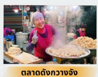
ตลาดดังกวางจ้ง