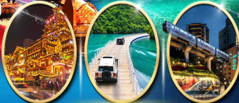
หงหยาดัง ประตูลิงโตแห่งเซวียนเอิน รถไฟฟ้าทะเลลึก

ราคาเริ่มต้น 20,919 บาท รวมภาษีมูลค่าเพิ่ม 7%