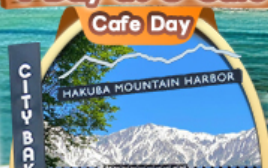
The City Bakery