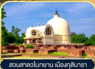
สวนสาละวินทยาน เมืองกุสินารา