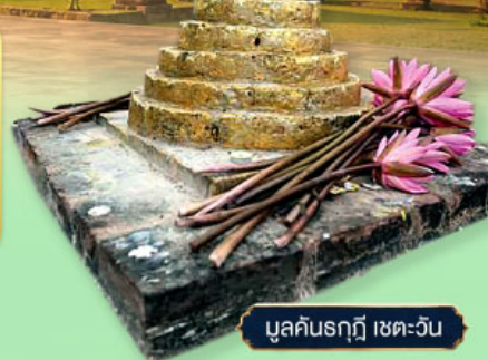
มุลคินรฤฎี เขตะวัน