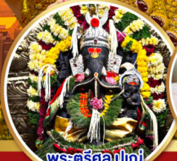
พระตรีศูล ปูเน่ (Trishul Pune)