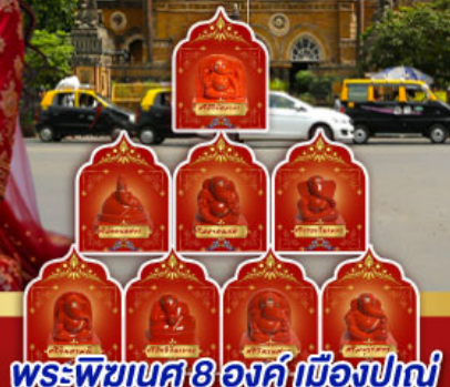
พระพิฆเนศ 8 องค์ เมืองปูเน่