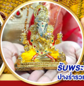
รับพระพิฆเนศวร ปางรำรอย ท่านละ 1 องค์