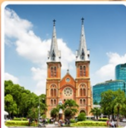
โบสถ์นอร์ทเทรอดาม