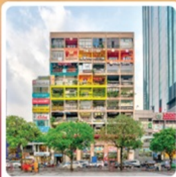
คาเฟ่ อพาร์ทเม้น

• ไฮไลท์!! นั่งรถจี๊ปสุดมันส์ ตะลุยทะเลทรายขาว สนุกสุดเหวี่ยงที่สวนสนุก VinWonders อิสระตามใจ