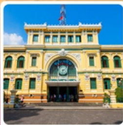
ไปรษณีย์กลางโฮจิมินห์