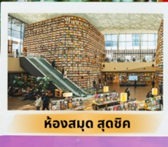
ห้องสมุด สุดชิค