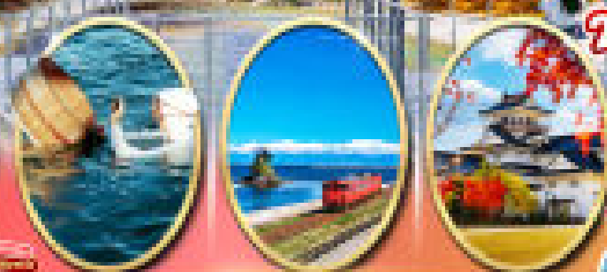
Mitsuo Pearl Island Onshoan's Coast Toyama Coast

2 ที่เที่ยวใหม่! ไร่ละ 10 ไร่ ไร่ละ 10 ไร่ ไร่ละ 10 ไร่